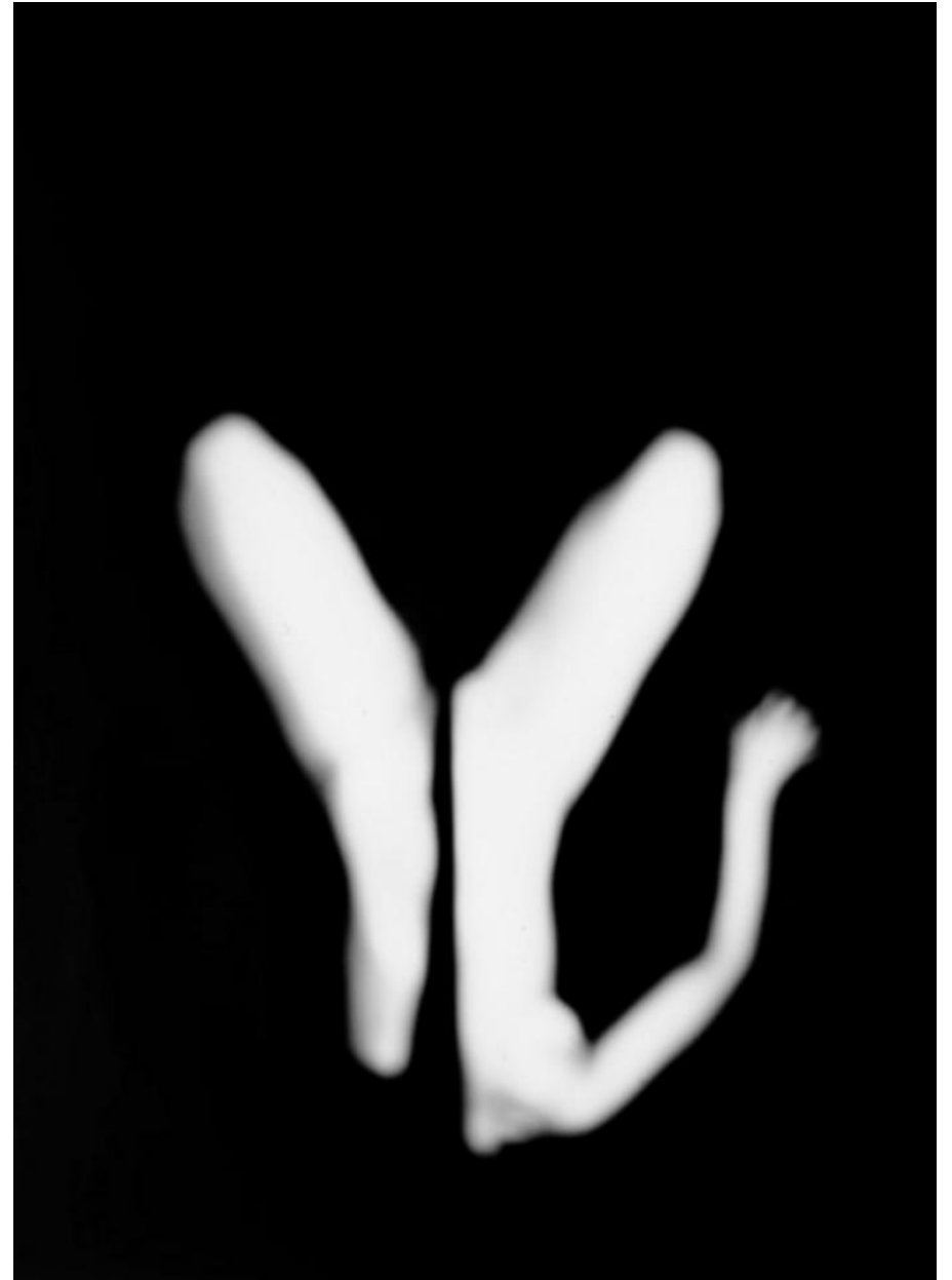
Anaïs Boudot "jigsaw feelings", photographie.