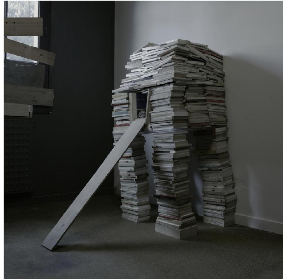
Michel Le Belhomme "La Bête Aveugle", photographie, 2009/2013.