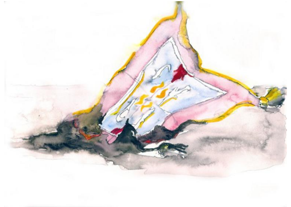
Nicolas Gaillardon, croquis tapis volant, aquarelle et encre sur papier, 24 x 32cm, 2010.