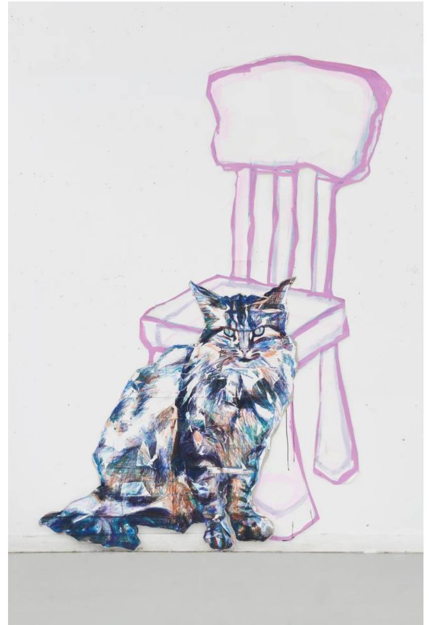
Paul Martin , Dans la chambre des enfants, techniques mixtes sur papier aquarelle et carton, 257 x 170 cm, 2013.