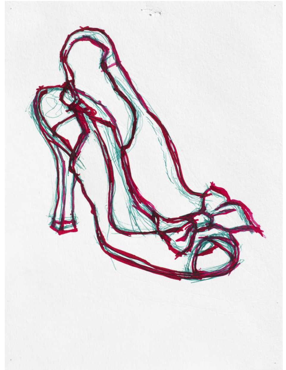
Alfonse Dagada , Sandale (noeud), stylo bille et encre carmin sur papier aquarelle, 40 x 30 cm,