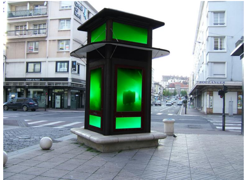
Aurélien Maillard , balise urbaine, projet d'intervention pour la ville de Boulogne-sur-Mer, simulation numérique, juin 2013.