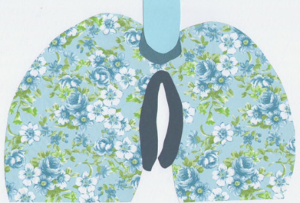
Isabelle / Juliette 2012, collages (tissu et/ou papier) in situ

Le spectateur se projette alors dans un face à face troublant, parfois douloureux, avec sa propre histoire, ses peurs ou ses fantasmes.