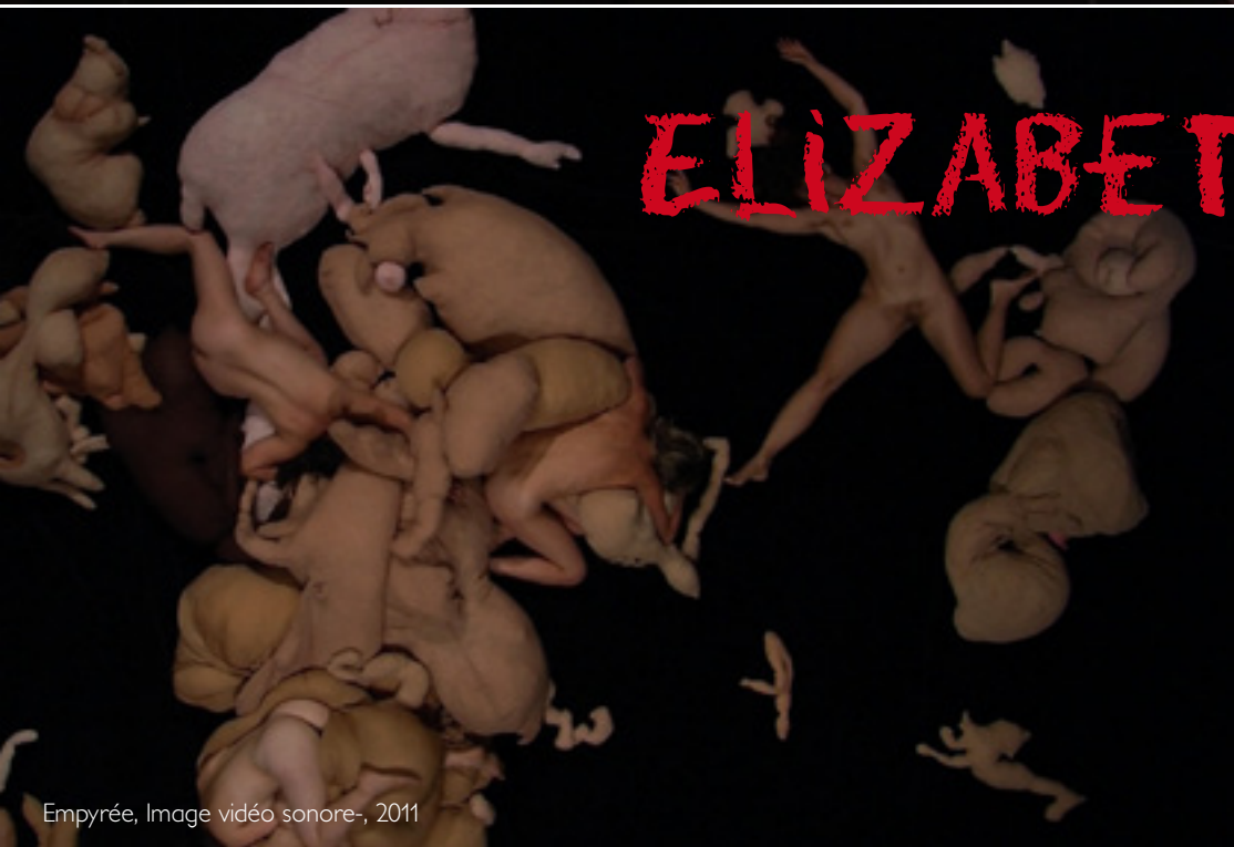
Empyrée, Image vidéo sonore-, 2011

Un Atlas dont le caillou-monde serait la maison-corps : petite bête qui reprend le cosmos à son compte et nous apprend le vide en digérant le bleu du ciel. Merde et création mises en spirale par la poussée d'un hymne de rien, de ce qui chante pour on ne sait quoi.