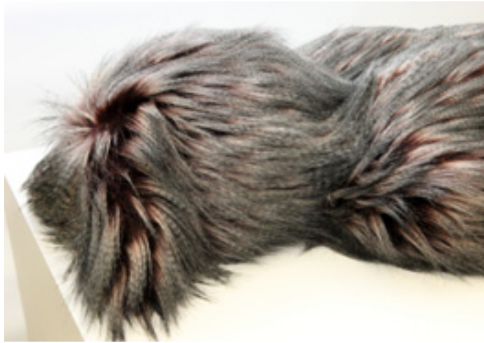
Elodie Wysocki, «Darwin», résine et fourrure, 2011