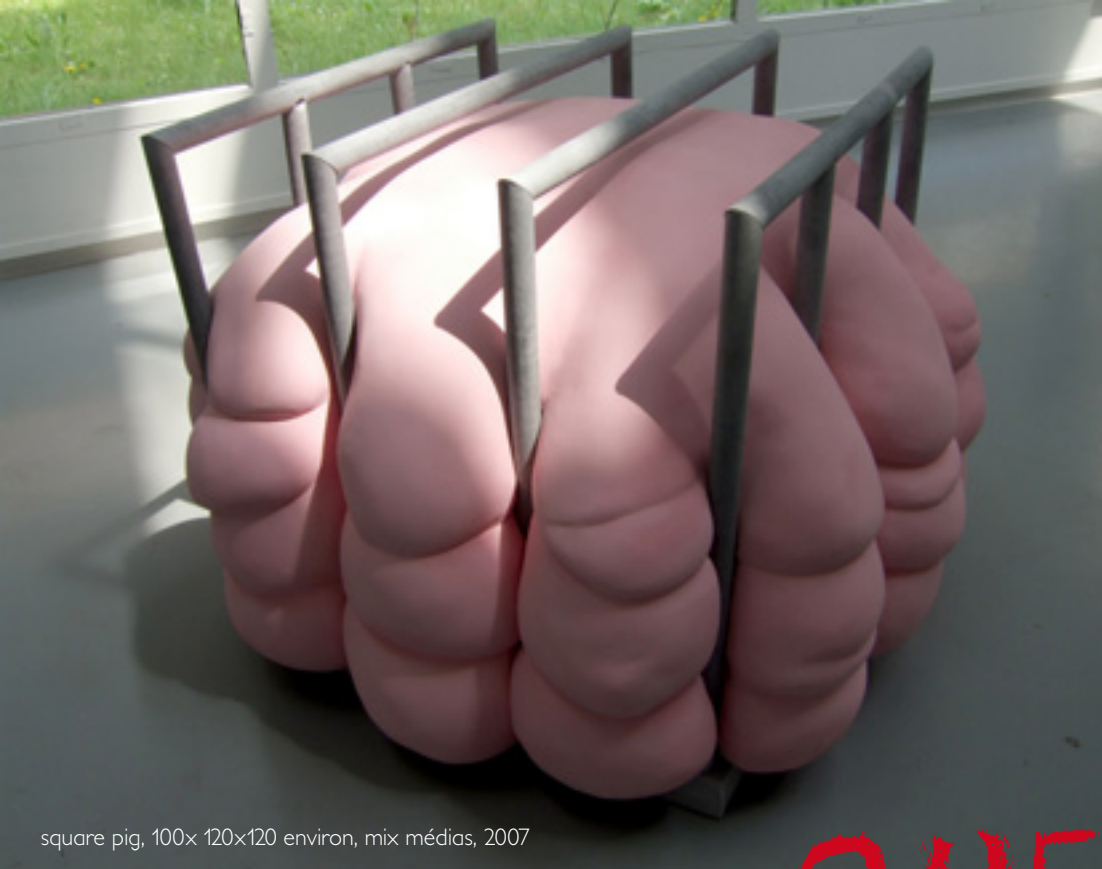
square pig, 100x 120x120 environ, mix médias, 2007