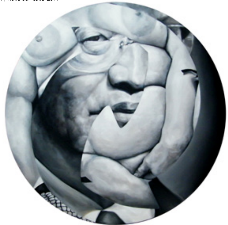
hu jin tao, 121 cm , huile sur toile 2011