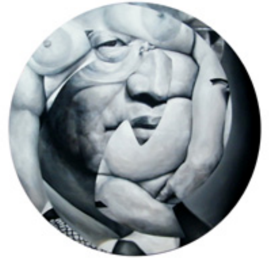
Quentin Scalabre, «hu jin tao», 121 cm , huile sur toile, 2011