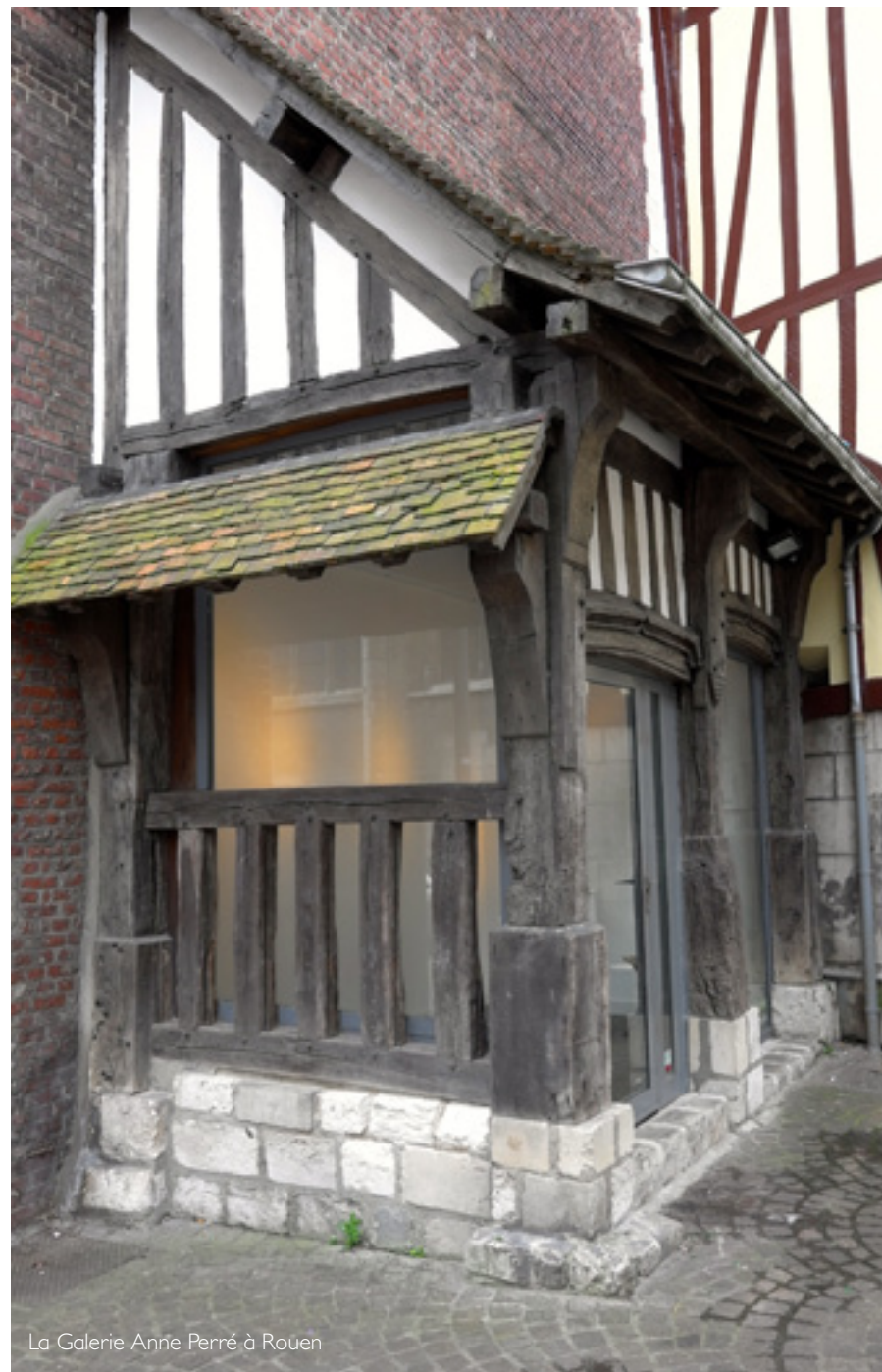
La Galerie Anne Perré à Rouen

Tél : 07 80 09 68 81 contact@anneperre.com www.anneperre.com