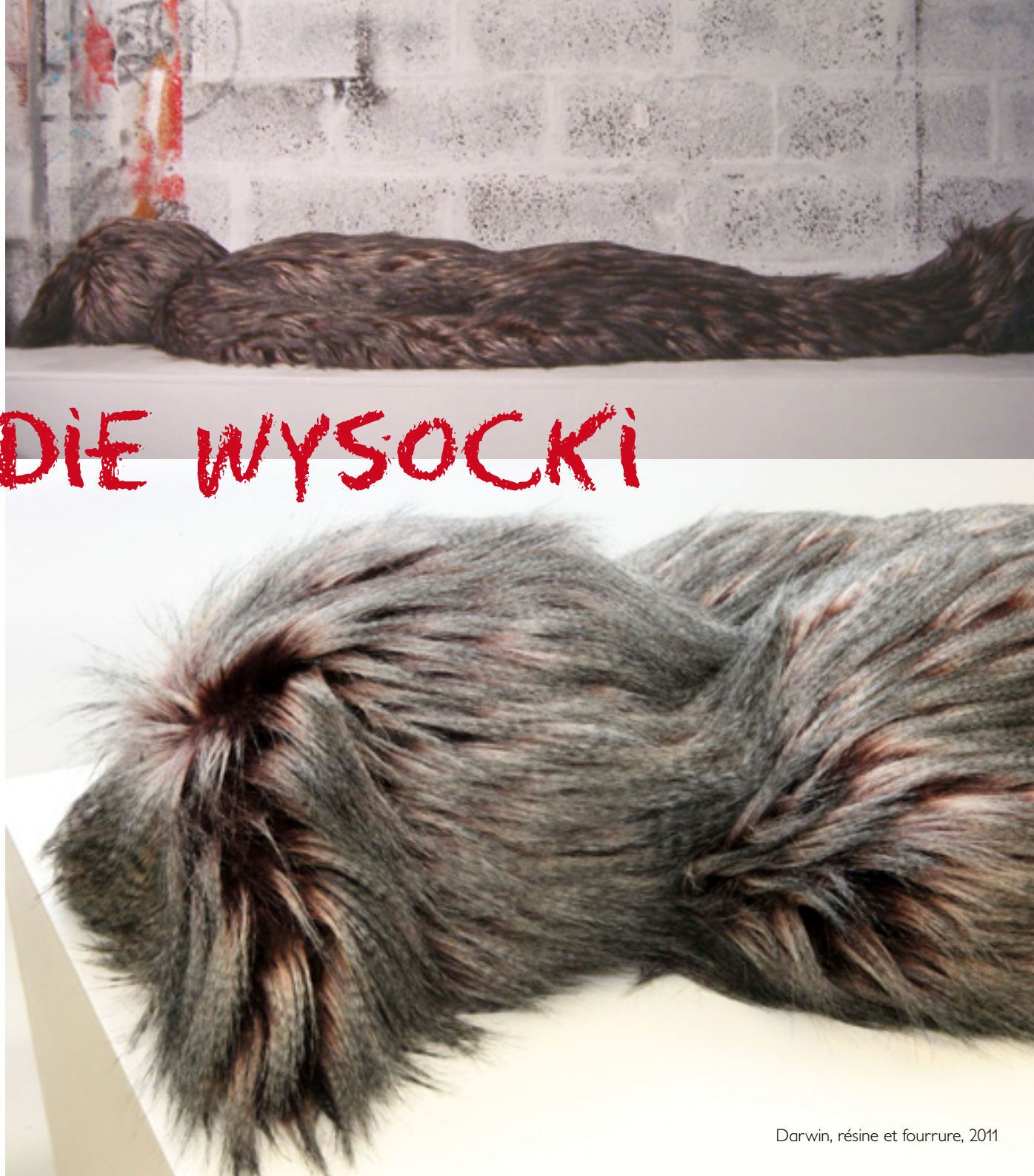
Darwin, résine et fourrure, 2011