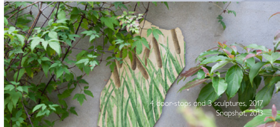
4 door-stops and 3 sculptures, 2017 Snapshot, 2013