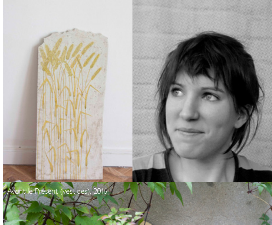
Avant le Présent (vestiges), 2016