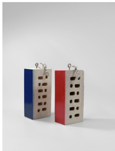
Vue du dancefloor et de la scène de l'Haçienda FAC 323: Brique montée sur porte-clé, 2017 FAC 338: Normographe, 2017