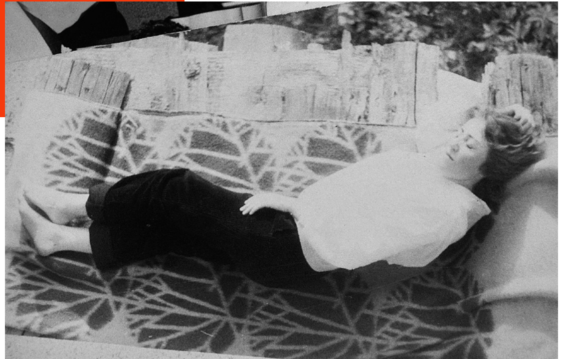
Ivaylo, Savina Topurska, 2016, vidéo, 3'51"